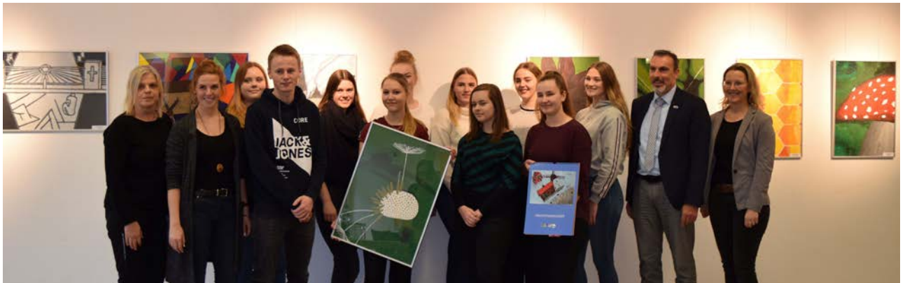
Foto: Bürgermeister Lürbke begrüßte die Schülerinnen und Schüler der Lippetalschule zur Eröffnung der Kunstausstellung

Seit heute ist die Kunstausstellung der Schülerinnen und Schüler der Lippetalschule zum Thema „50 Jahre Lippetal“ in Haus Biele in Hovestadt zu besichtigen. Jeweils zu den Öffnungszeiten des Bürgerbüros kann der Schlüssel zum Bürgersaal dort geholt werden, um die 30 Kunstwerke zu besichtigen. Noch bis zum 11.04.2019 besteht dazu die Gelegenheit.