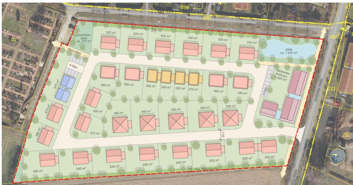
Abbildung 1: Städtebaulicher Entwurf, ohne Maßstab

Die Erschließung des Plangebietes ist mit einer Anbindung an die Nordwalder Straße vorgesehen. Insgesamt ist eine ringförmige Erschließungsstraße angedacht, von der fuß- und radläufige Anbindungen an das umliegende Wegenetz abgehen. So ist jeweils eine Anbindung in östliche und westliche Richtung vorgesehen. Die westliche Anbindung soll dabei zusätzlich als Notzufahrt für PKW genutzt werden können. Der bestehende Fuß- und Radweg entlang der Nordwalder Straße wird mit der vorliegenden Planung gesichert. Im nordöstlichen Bereich des Plangebietes ist ein Regenrückhaltebecken vorgesehen, um das im Plangebiet anfallende Niederschlagswasser zurückhalten und anschließend gedrosselt einleiten zu können.