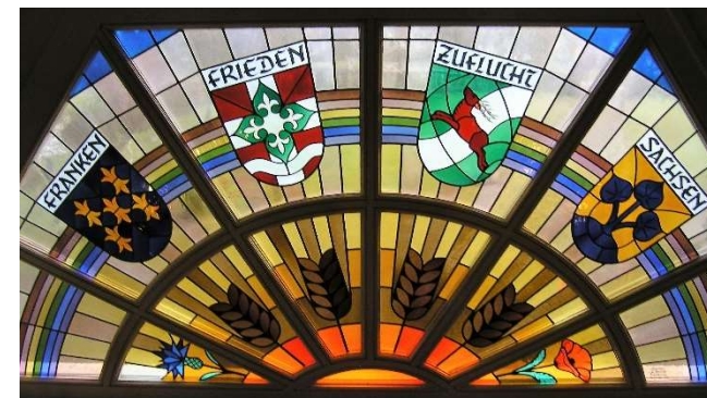
Torbogen im Pfarrzentrum Haus Idenrast